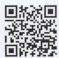
แบบฟอร์มส่งสลิป