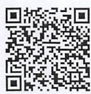
ข้อมูลการจ้ดอบรม