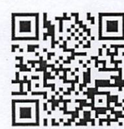
แบบฟอร์มลงทะเบียน